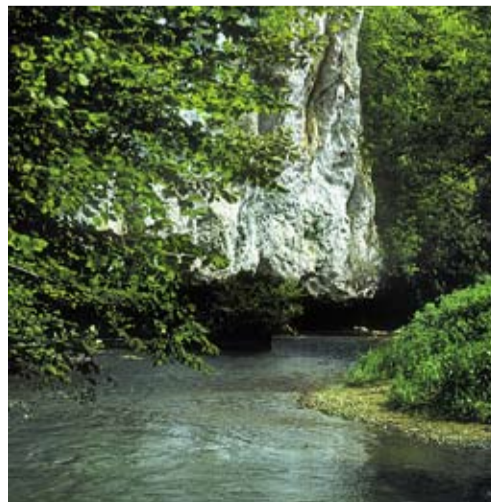
Gorges de la save Montmaurin

In de directe omgeving zijn prachtige wandelingen te maken o.a. langs de Gorge du Save. De rivier de Save heeft in de rots aldaar een loodrechte doorgang uitgesleten, waar behalve wandelen ook kletteren mogelijk is. Voorts zijn er op de website van Château de Barbet diverse wandelingen uitgeschreven. Ook bij het V.V.V. te Samatan zijn gratis een vijftal wandelingen in de omgeving te verkrijgen. Wij wensen u prettige wandelingen toe.